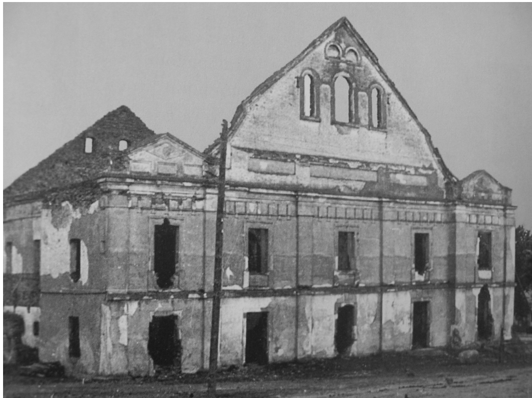
Il.49.Synagoga w Krynkach-stan przed 1963 r.