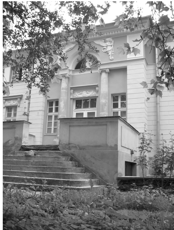
Il.47. Instytut Meteorologii i Gospodarki Wodnej we Wrocławiu- elewacja frontowa –stan obecny.