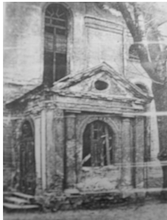
Il. 44. Synagoga w Kępnie- nieistniejące wejście od południa.