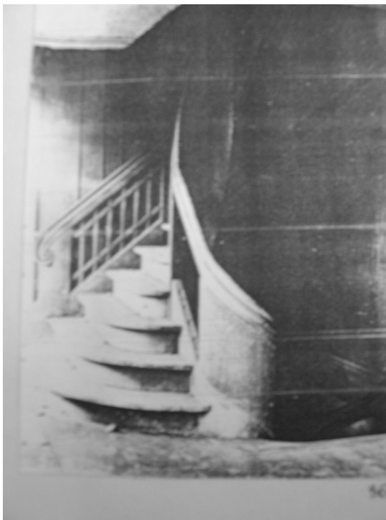
Il.43. Synagoga w Kępnie- klatka schodowa prowadząca na empore dla kobiet.