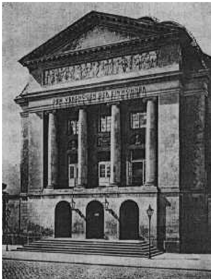
Il.34. Fasada teatru w Poczdamie