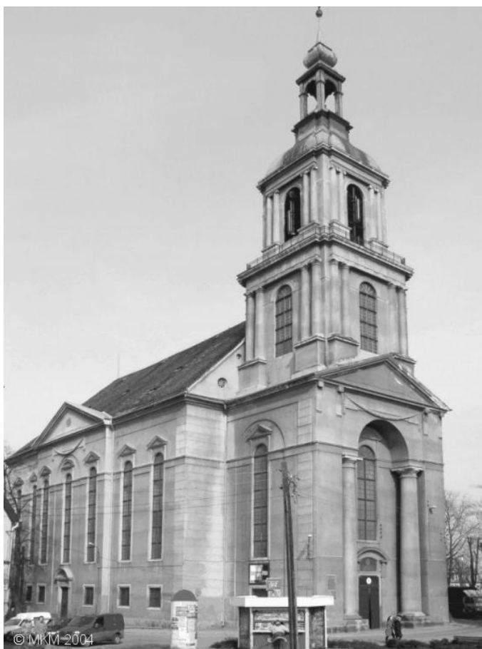
Il.32. Zbór ewangelicki w Dzierżoniowie- stan obecny