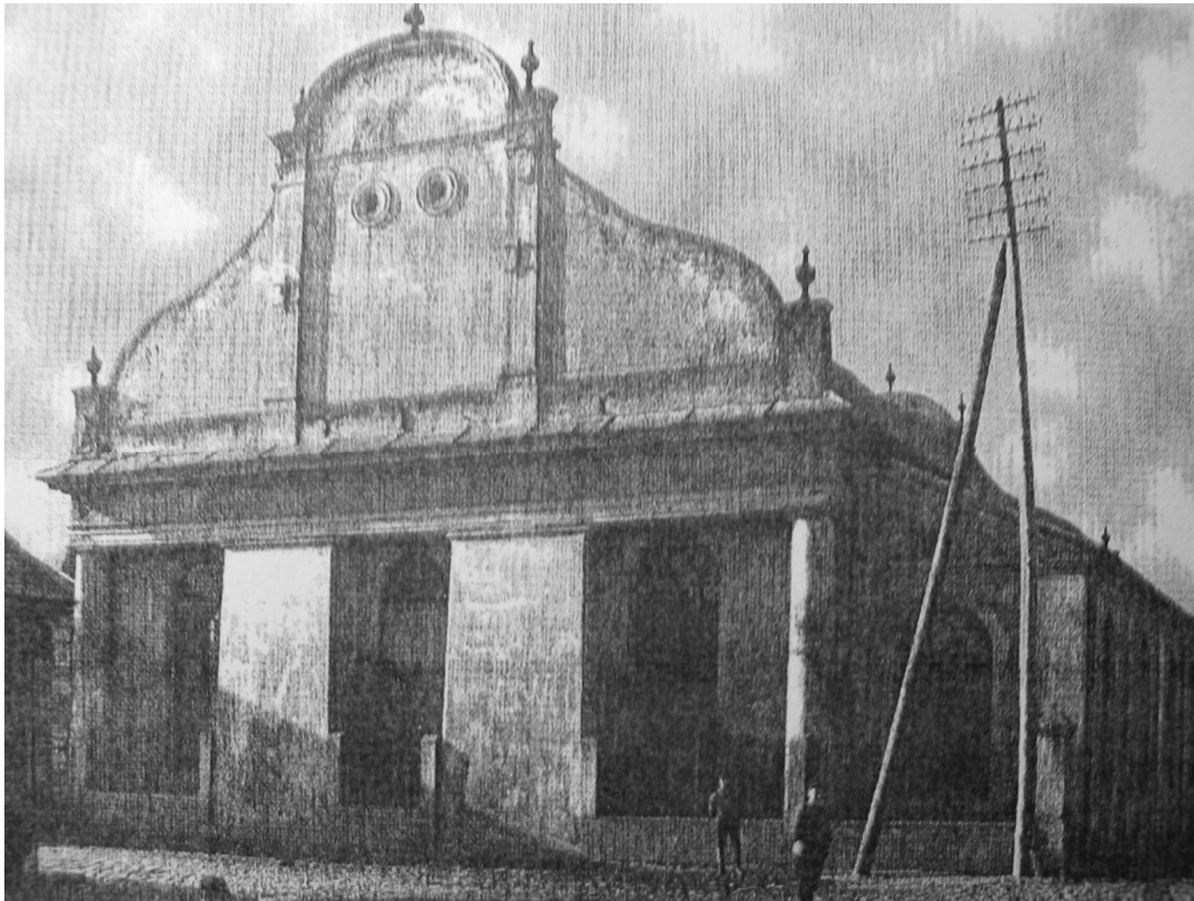
Il. 40. Synagoga w Kutnie.