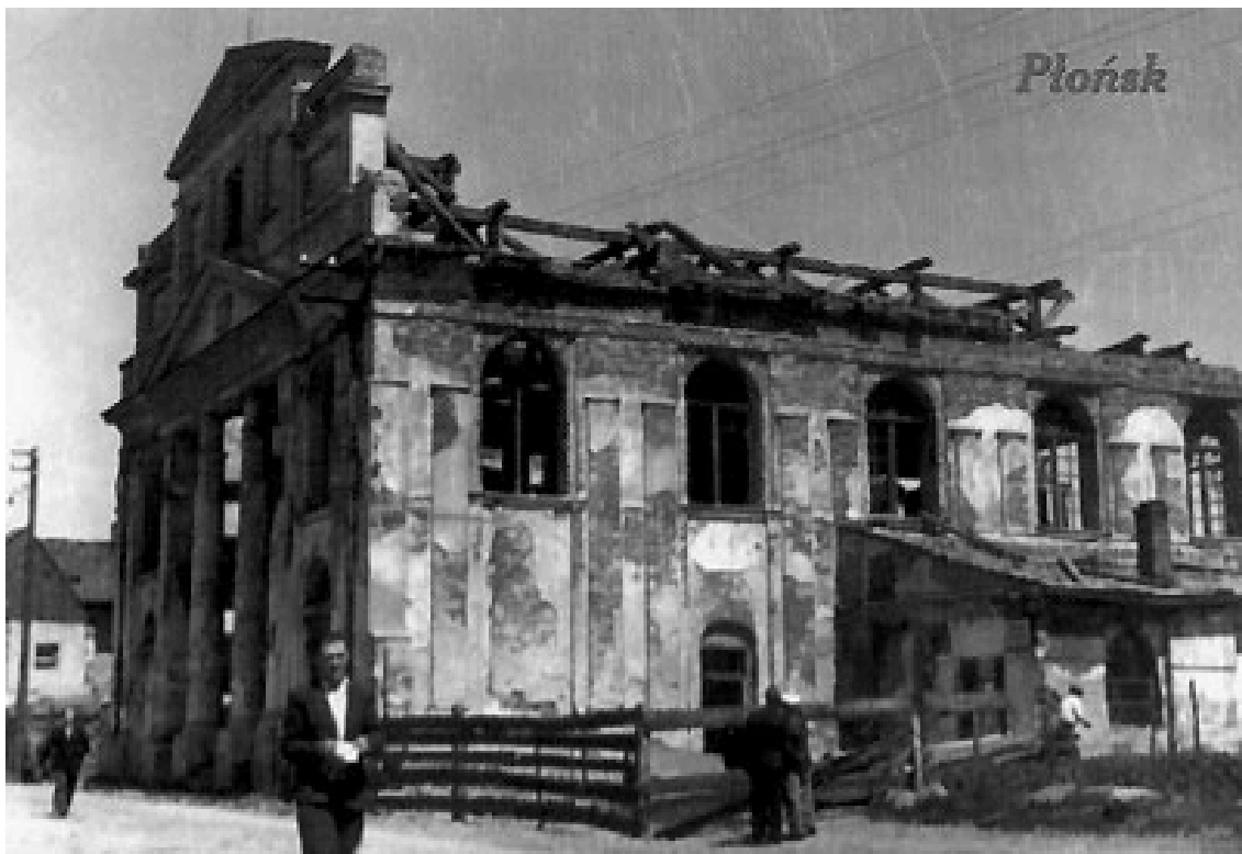
Il. 39. Synagoga w Płońsku z 1851 roku.