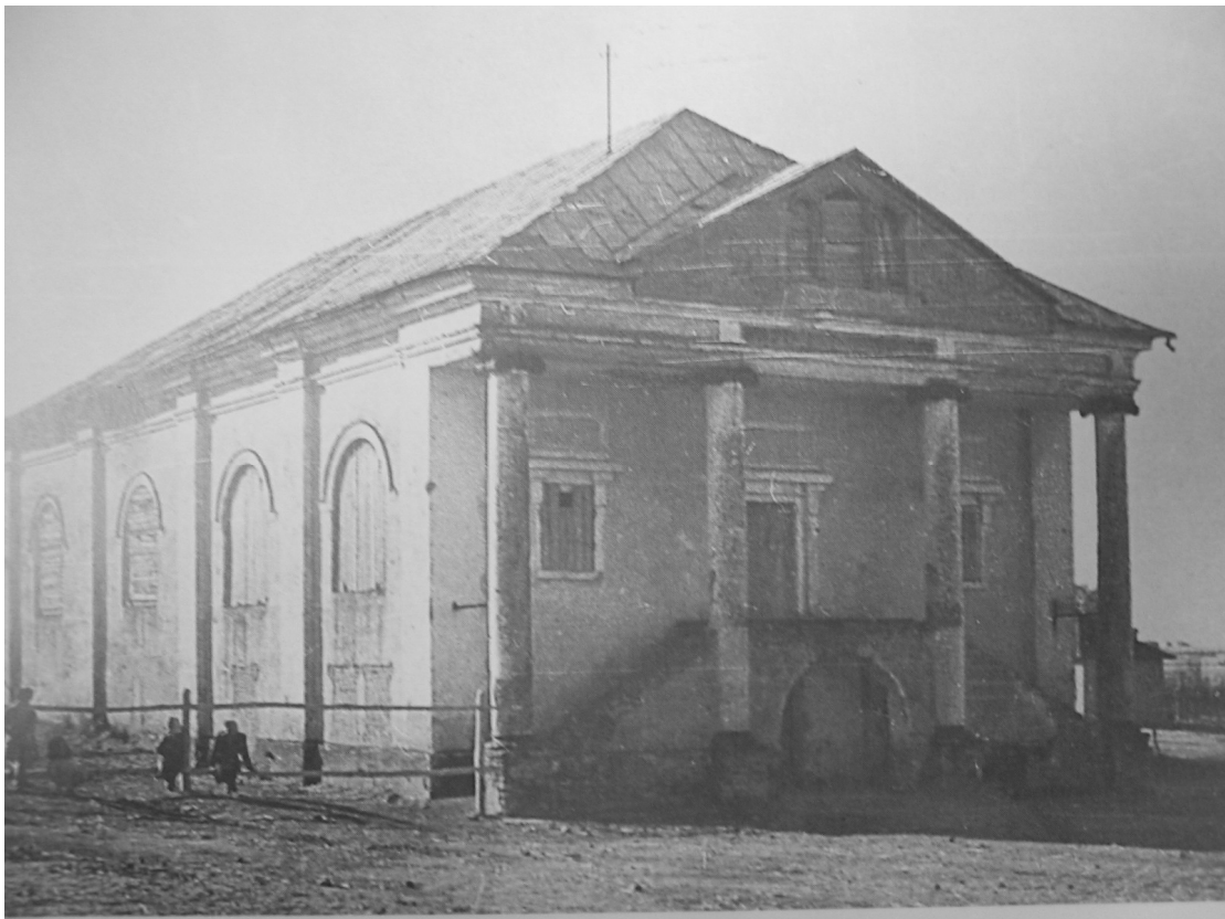
Il.37 Synagoga w Klimontowie z 1851r.- stan z 1952 roku