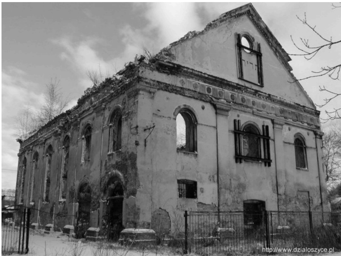
Il.38. Synagoga w Działoszycach z 1852 roku.