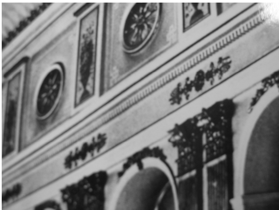
Il. 35. Detal wnętrza projektu Carla Gottharda Langhansa.