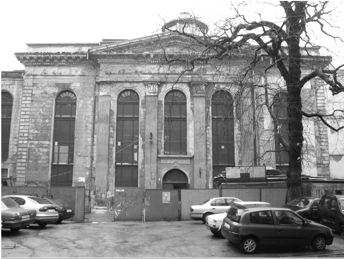
Il. 36. Fasada synagogi pod Białym Bocianem, stan obecny